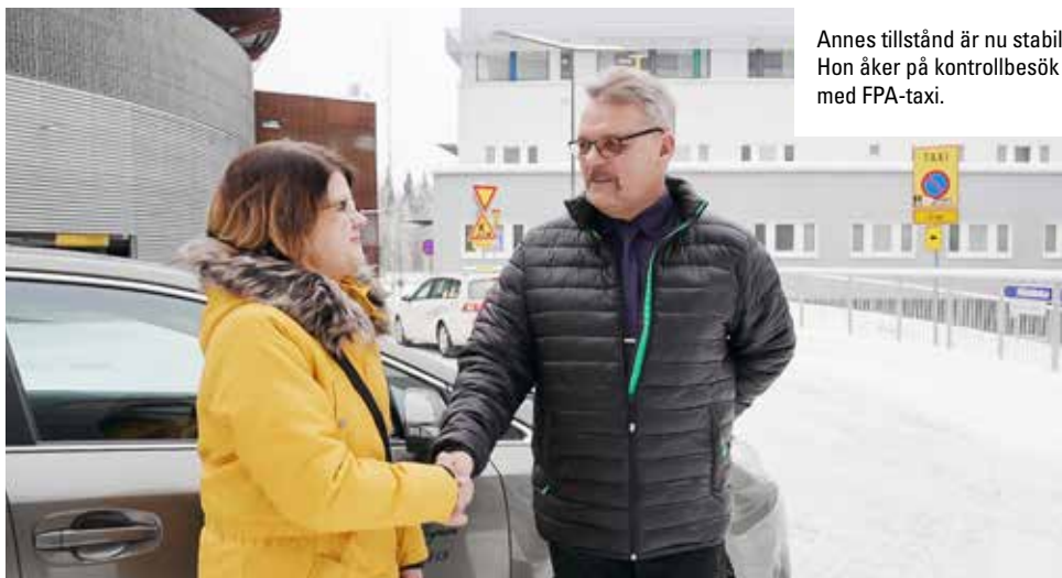
Annes tillstånd är nu stabilt. Hon åker på kontrollbesök med FPA-taxi.