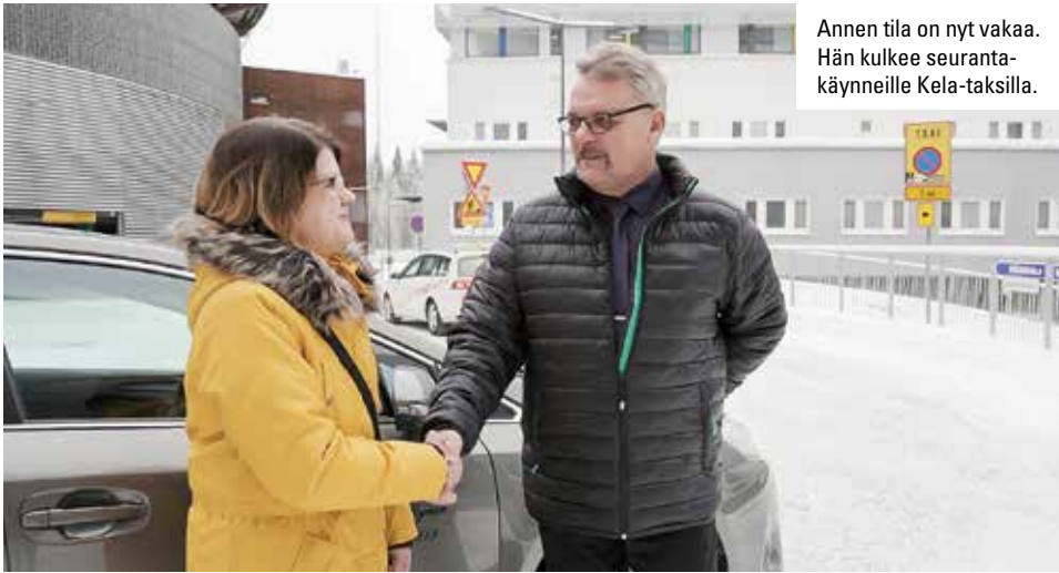
Annen tila on nyt vakaa. Hän kulkee seuranta-käynneille Kela-taksilla.